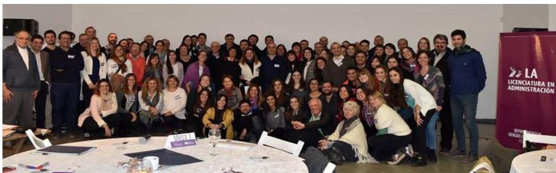
Foto grupal del 3º Encuentro de Docentes de Administración